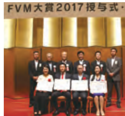
FVM大賞への登壇門 マンスリーマーケット へのご希望は下記まで ご連絡ください。 092-725-2729