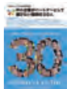
一般社団法人 中小企業事業推進機構 092-739-5357 http://persona.venhoo.com/ ベルソナガイド←検索

中小企業を集め、経営相談やビジネスモデルの構築、販路開拓、従業員研修など様々な角度から中小企業の経営を支援する活動を行っている「一般社団法人中小企業事業推進機構」を存じだろうか。 同機構が発行した、人となりがベルソナガイド「中小企業がパートナーとして選びたい福岡の30人」がAmazonランキング新着部門、ビジネス・経済部門で1位を獲得し、その出版を記念した300人規模の大交流会が7月29日に西鉄ソラリアホテルにて開催された。 同書は、中小企業経営者、創業間もない方、起業準備中の方、今から社会に出ていく学生、NPO法人や社会起業家、また定年退職を迎え今後の人生を考えている方などに向けて、起業家である30人の著者たちが過去の苦難をどう乗り越えたのかを伝えようと企画された。 同書には32人の生き方や価値観、苦難を通して学んだことなどがリアルに表現されており、その「人としての魅力」と「稀にみる経験値」を、多くの方に知っていただき、パートナーとして繋がっていただきたい、同機構では、「ベルソナガイド」という形でWeb上でのプロモーションもしている。